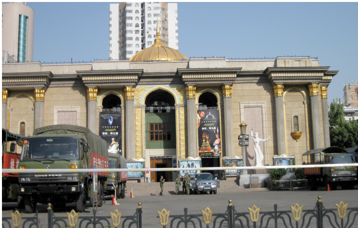
2009年秋军车和士兵驻扎在乌鲁木齐一个剧院外面。

三位前去报道示威的香港记者被民兵毒打拘捕。 117 尽管这三位记者全部携有采访许可，但