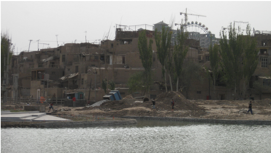
正在拆迁的喀什噶尔老城一景.

2009年初期，中国政府宣布对东土耳其斯坦南部、维吾尔文化的摇篮喀什噶尔老城将进行彻底改造。这一“居民重建项目”的目的是在随后的5年里，将大约5平方公里范围的维吾尔传统民居推平。正如一位老城区的维吾尔居民所表达的那样，维吾尔人被隔离与这一毁灭性项目的制定，他们的看法透露出无助和绝望。