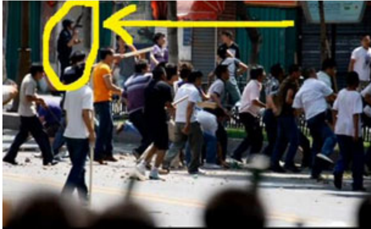
当乌鲁木齐汉族人在7月7日充斥大街小巷时，手持武器的中国军警毫不阻拦， 波士顿环球报，美国维吾尔人协会圈点。

一位乌鲁木齐市的老居民报告说， 97 警察通知一个街道清洁工在7月6日不要去发生严重枪击的地点进行清扫。这位清洁工补充说，这些街道早在早晨3点就被清洗了。