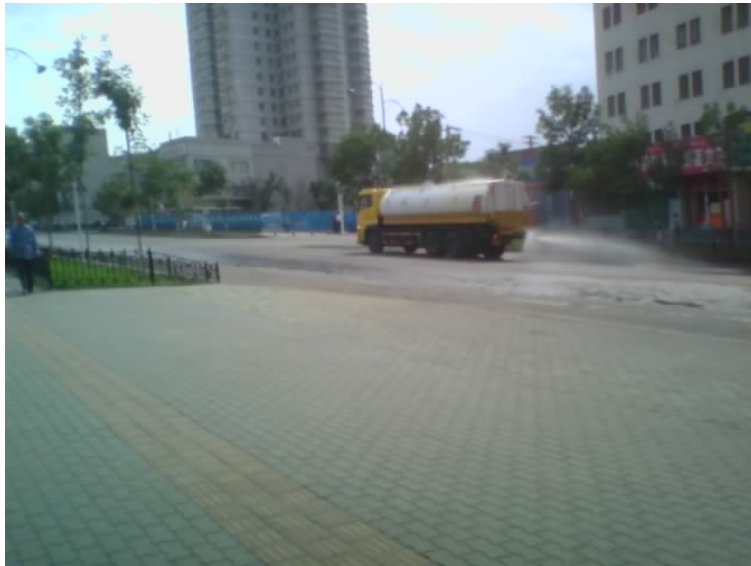
一辆水车在7月6日早晨清洗街道。

“那时汉人的数字。我们有自己的数字……很多很多的维吾尔人被杀。军警由于恐惧而失去了控制。” 107