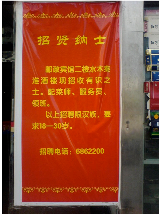
喀什噶尔邮政宾馆外面的招工广告，照片摄于2009年7月1日。最后一行写到“以上招聘只限汉族，年龄要求18-30岁。”见大西洋月刊

“我们每天工作10小时以上而且绝大部分时间都要加班。我们5点下班6点回来换班，工作到凌晨2、3点。” 25