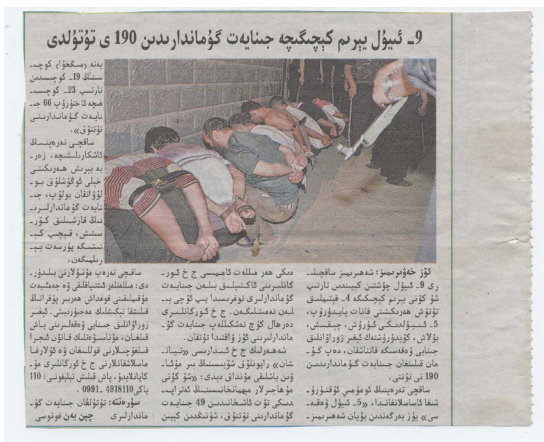
乌鲁木齐一报纸报道的2009年7月9日实施抓捕行动中的被捕人员。

新疆当局对75/事件的反应就是在7/5之后对维吾尔人民的残酷镇压。自2009年7月6日凌晨开始的数周数月之内，在东土耳其斯坦的乌鲁木齐及其他地区的维吾尔人被置于广泛的随意抓捕和“强迫失踪”。《人权观察》在2009年10月份的一份报告指出， 156 自7月6日开始，中国军警在乌鲁木齐的两个维吾尔人聚居区展开了大规模的抓捕行动，成群结队的维吾尔青年被装入卡车或吉普车。根据维吾尔人权项目的访谈得知，7/5以后维吾尔人社区