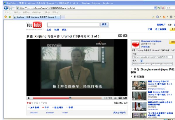
古丽美拉在判刑前夕在中央电视台的谈话截图。