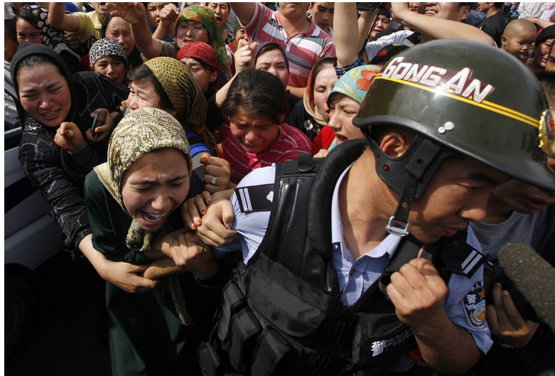
2009年7月7日维吾尔妇女抗议她们的男性亲属被拘捕。

一位受访者告诉维吾尔人权项目，其在2009年7月6日路过维吾尔人居民区时，看到拿着机枪的士兵们把住维吾尔居民的院门。 161 此受访者大概经过了50个楼房，看到只有妇女在里面。