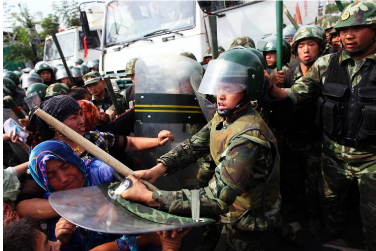
中国的军警推搡示威的维吾尔妇女。

睹军警开枪的学生全部被警察带走。学校官员将2009年的开学时间推迟到10月份，而不是正常的9月份。