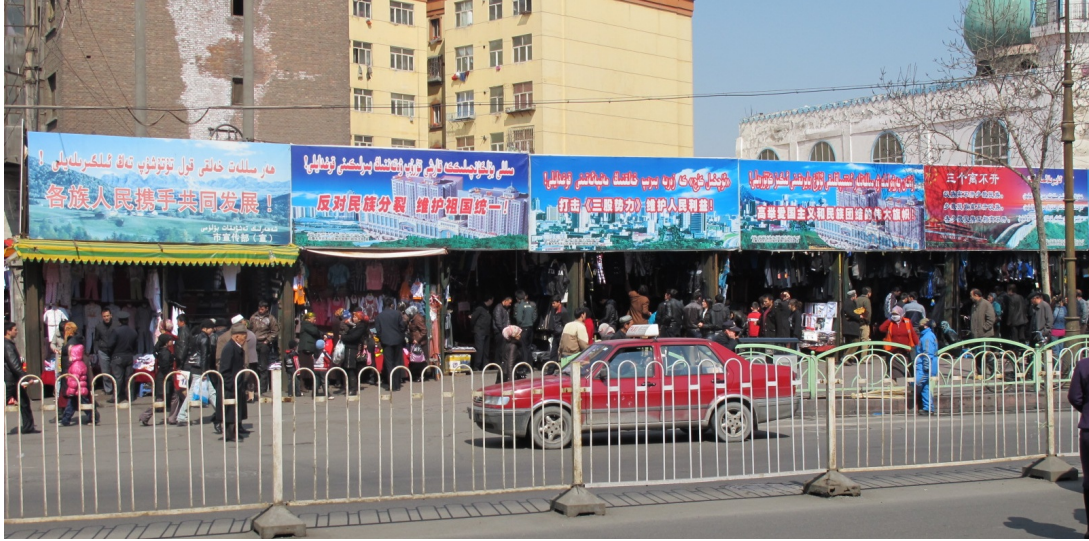
乌鲁木齐街道“民族团结”宣传牌。

片从互联网上很快被删除，而且有关骚乱的信息在中国其他地方的互联网上也被封锁。甚至中国东部的网民对此骚乱的网上评论也被审查。例如，张贴在一个以上海为基地的网站 pchome.com 上关于骚乱的评述在数小时之内被删除，而被代之以“此张贴不存在”字样。 50