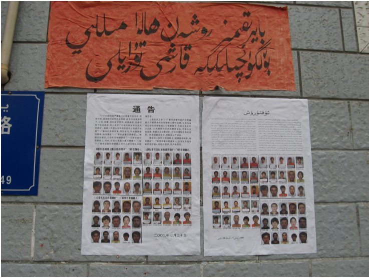
乌鲁木齐张贴的同7/5有关的人员名单和相片的通缉令。匿名提供

第三位受访者报道说，其在7月5日目睹了军警在他家附近、即二道桥大巴扎附近围捕甚至包括小孩在内的维吾尔人。 163