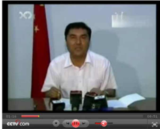
自治区主席努尔·白克力在2009年7月6日的电视讲话