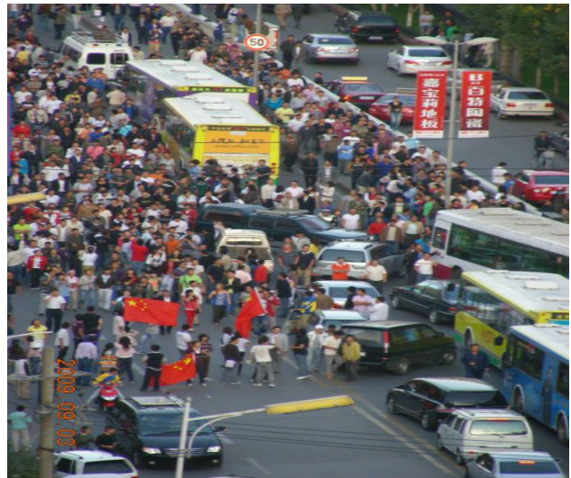
汉人示威者2009年9月3日在乌鲁木齐的街上游行抗议。

政府立马惩处了那些被认为或据说同针管袭击有关的人员。到九月中旬，官方报道说有75人被抓捕，7名维吾尔人被判刑。 108 受访者为维吾尔人权项目提供了维吾尔人在此期间被任意抓捕的一手或二手材料，其中包括至少一名维吾尔人在关押期间死亡（相关更多信息，请看本报告“抓捕”部分）。