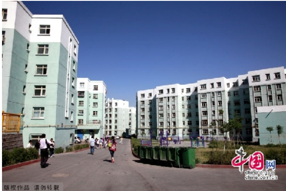
“乌鲁木齐黑甲山区提升工程——和谐美丽的各民族大家庭。”

官方网站定义博览会为：以将“新疆建设成为西部开发的桥头堡”“实现新疆快速发展和长治久安的战略手段。” 165