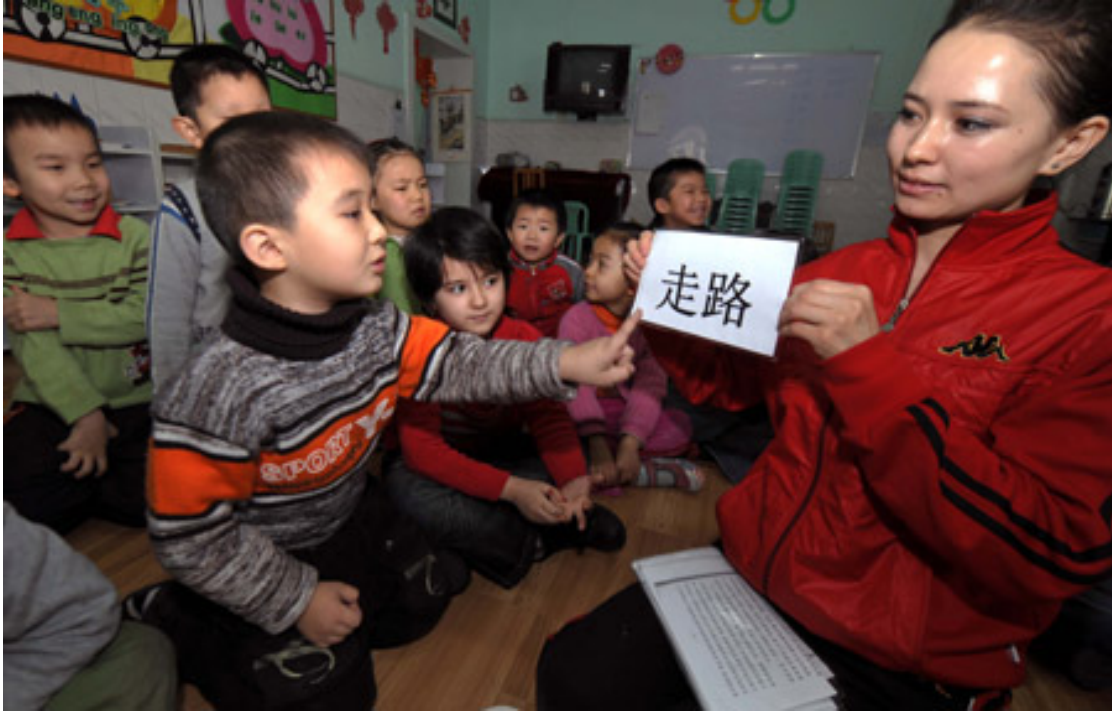
乌鲁木齐年轻的维吾尔学生在“双语”幼儿园教汉语。

中共官员对维吾尔语的歧视和贬低也反映在中国政府教育政策上。自2002年开始，中国政府以强势高压在东突厥斯坦大中专院校实施了所谓的‘双语’教育政策，事实上将维吾尔语排除了教学环境；这政策的目的是将维吾尔学生有母语教育转为汉化教育。‘双语’教育的最终目的看起来是在全东突厥斯坦范围内用全面汉化教育替代维吾尔语教育。