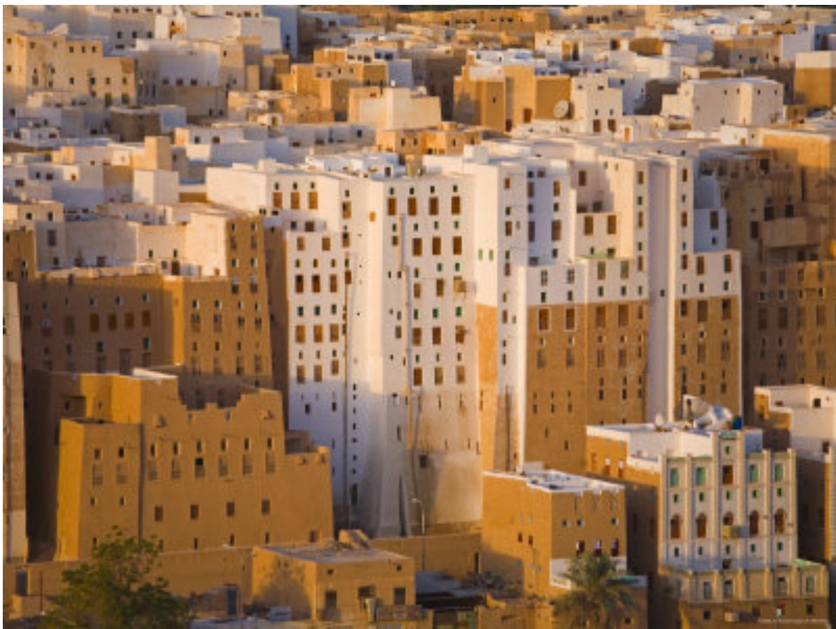
西巴姆，也门

环球遗迹工作网（GHN）遗址监督者提供的一份有关喀什噶尔老城拆迁报告特别指出泥草混合建筑结构专家早已给出了在老城强化地基后重建老泥草建筑费用并不高。遗址监督者建议中国官员采取措施保留目前划定两个保留区外更多的居民建筑。报告指出，既然大多数老城居民宁愿呆在他们泥土房屋也不愿去城外爬上爬下的六层楼房，保留更多的泥土房能就增进维吾尔人对改造工程的支持。 239