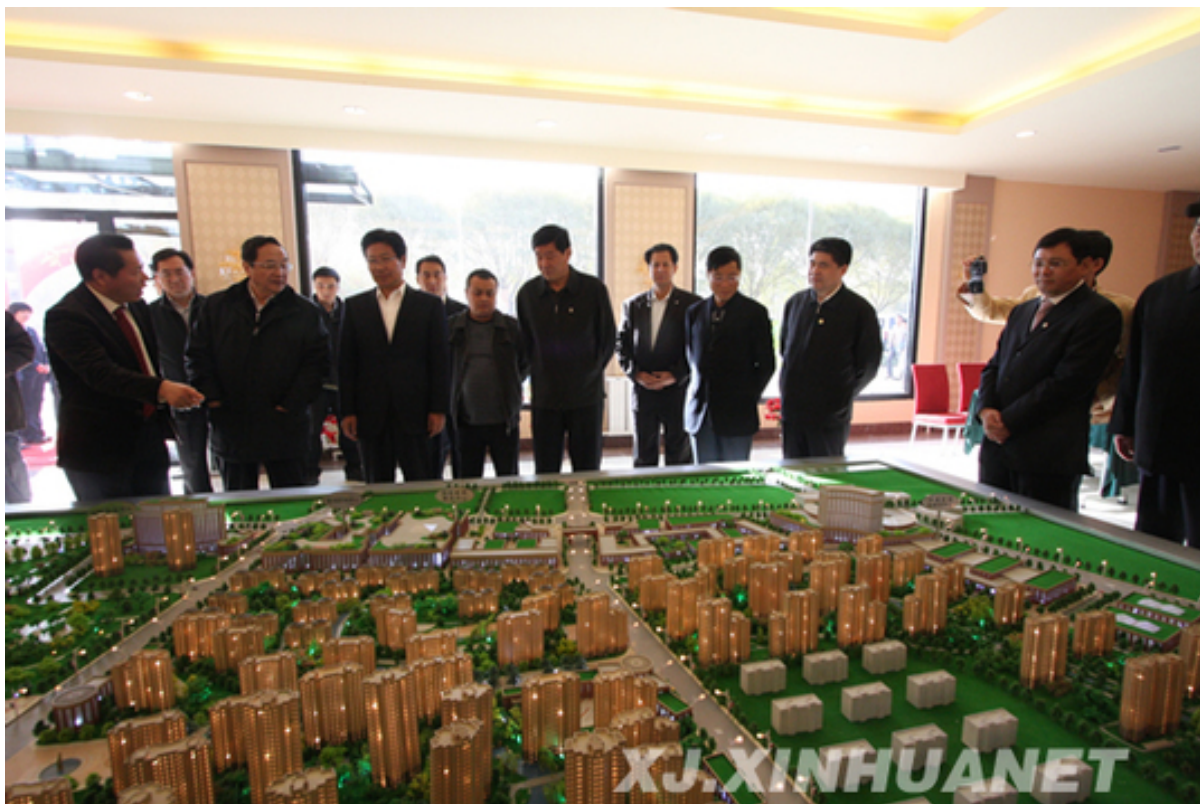
来自新疆和上海的官员在看上海援建的喀什噶尔商业发展区模型

东突厥斯坦的社区‘重建’和‘安居’工程是在2010年上半年召开新疆工作会议、‘国家一对一援疆’会议安排及‘新疆第12个5年计划’中确定精神展开的。 125 被官方称为‘进行了几年的抗震加固安居工程’，为‘提高居住条件、提供舒适住宅’的项目自2010年9月开始实施。 126