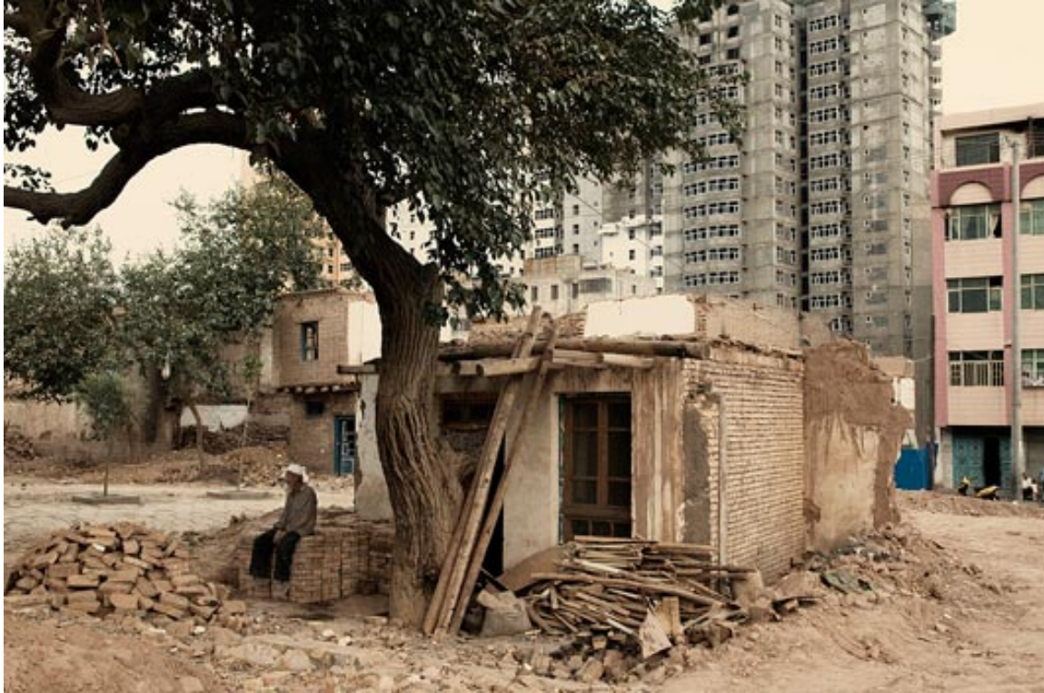
一位75岁的维吾尔老人坐在他即将被拆迁房前

维吾尔人权项目对中国政府发起发展规划及对维吾尔人社区拆迁的关注并不表示我们反对发展。维吾尔人权项目是为维护维吾尔人经济、社会以及文化权利服务的。拥有平等的经济机会及文化表达自由是一个健康正常运行社会的标志。就居住来说，维吾尔人权项目认为如果是为了摆脱贫困而安装现代基础设施是必要的。