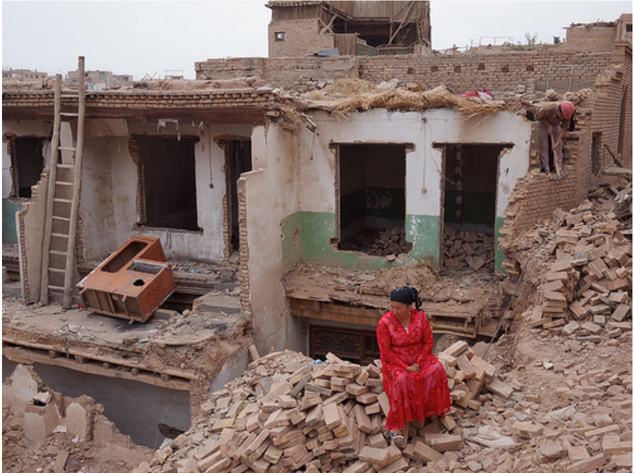
喀什噶尔老城一位妇女坐在她被拆毁房屋废墟上。

近年来，特别是自西部大开发实施以来；中国政策制定人将维吾尔生活的方方面面当作现代化的目标；和汉文化相较，视维吾尔文化为落后。将现代化与融入所谓先进文化的汉人社会画等号，将其强加于维吾尔文明的方方面面，包括维吾尔信仰及对维吾尔学生的教育等；对此本报告在其他部分已经详细探讨。“落后”一词被中国政府滥用于讨论支撑维吾尔社会的物质结构和非物质结构—社会文化现象时。维吾尔人和其传统房屋的有机联系意味着近来的拆迁使维吾尔传统社区被破坏。