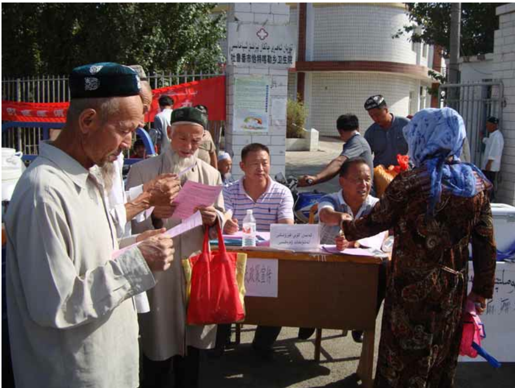
吐鲁番市村干部向村民散发安居富民宣传单。

然而，2011年9月中央媒体报道吐鲁番市区仍有近70000间不符合自治区政府制定新安全标准房屋。根据中国广播网，吐鲁番有39369间房屋需要重建，25191间需要“改造”或“提升。”湖南省为实施“改造”提供资金，确定目标位在5年内完成。 182