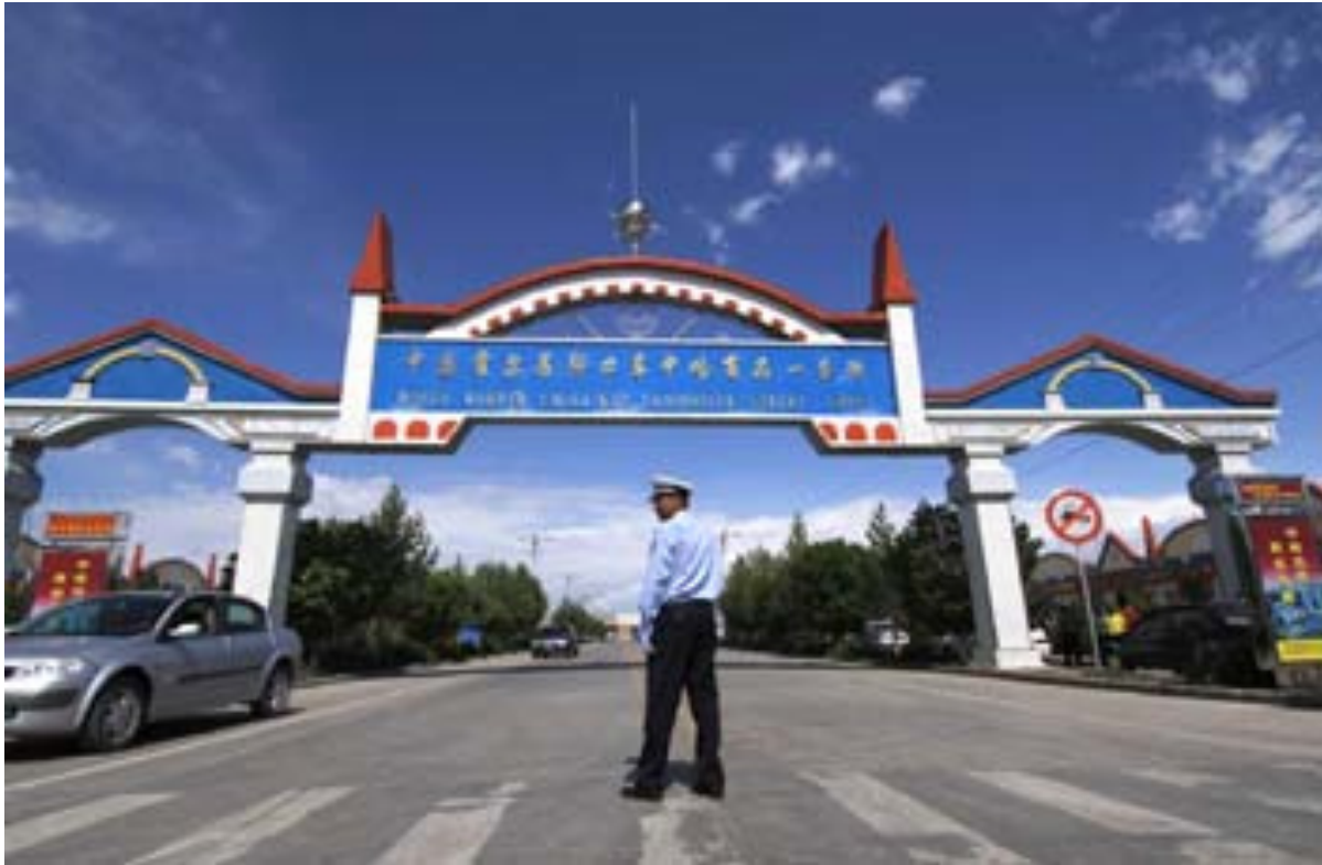
霍尔果斯特别经济区