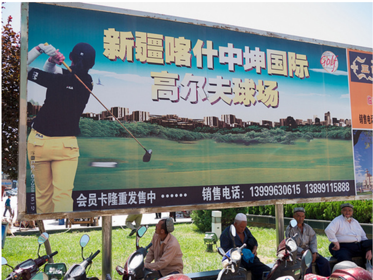
喀什噶尔的广告牌

维吾尔人不仅被赶出了家园，也被高昂的房地产价格挡在他们自己社区之外。这种将维吾尔人迁居到摄像头密布的郊区烂楼，是到处存在的将维吾尔人从自治区经济中边缘化、剥夺他们文化、被动面临国家鼓励移民洪流模式的典型反映。