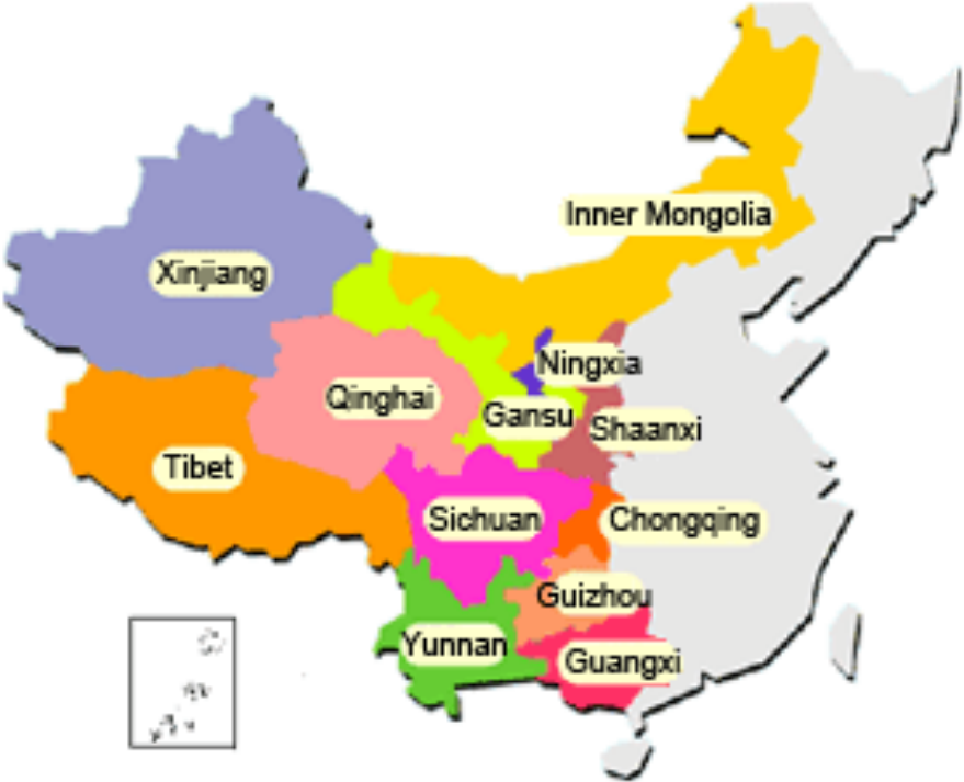
Provinces of Western Development