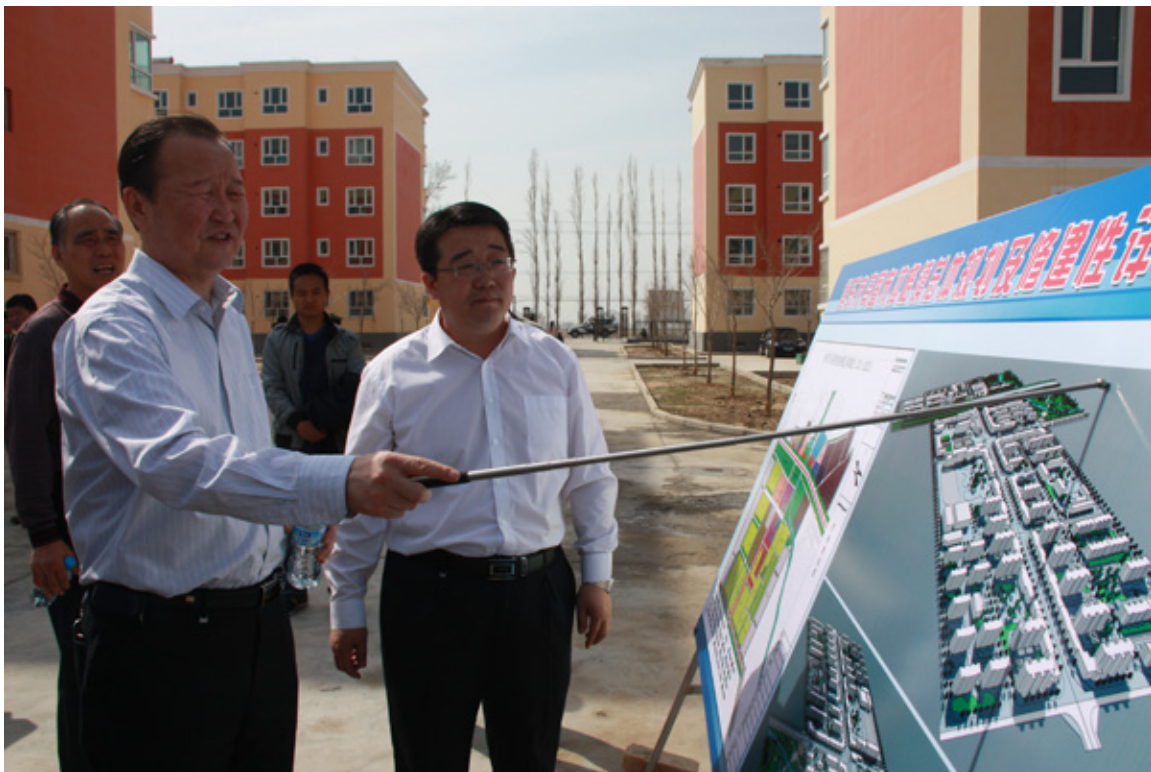
当地官员视察博尔塔拉“吾土布拉格镇团结小村”“安居富民”发展蓝图

根据博尔塔拉市府官员；总共有2624户房屋作为棚户区拆迁工程而被“改造。” 197 博尔塔拉官员说；600户房屋被拆迁这作为“改造”受益者将搬进新建“快乐家园”商业小区。发展开发是在中央第12个5年计划及对口支援湖北省的支持下实施的。。拆迁由一私人公司于2010年12月在博尔塔拉市政府和党委指导下开始的。 198