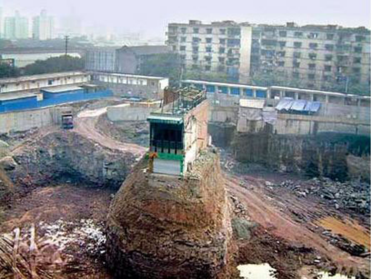
因拒绝拆迁而孤单矗立于发展工地的房子，重庆。©外事政策

最近发生一件案例看来该法规未能有效阻止非法拆迁征地。2011年12月成千上万广东乌坎村民走上街头抗议村政府征用倒卖价值$1, 540, 000的村用土地。12月中旬警察封锁了乌坎村、断绝了乌坎食物来源。实际上，乌坎村民抗议了一个多月，只是在12月因为政府逮捕了五位村民选派的谈判代表而激化；其中一位谈判代表12月12日死亡，村民指责是警察将其打死的。根据一位西方媒体记者的报道：两名乌坎小孩被严重打伤，一位极有可能已经死亡。 100 村民最终和官方达成了协议，但到本报告发布为止几项至关重要的民村要求还未得到满足。 101