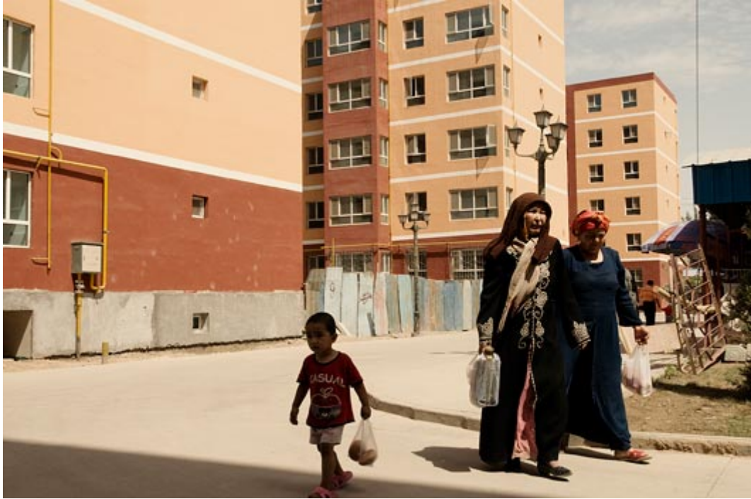
喀什噶尔郊外新公寓里的维吾尔居民

有散落于老城维吾尔社区的小清真寺看，信仰一直是维吾尔人生活的具体中心。坐落于毗连狭窄胡同的老房、茶社，加这些社区清真寺构织成了老城社会生活的主体。拆迁老城的绝大部分造成了至少一个或可能很多清真寺的拆毁以及围绕这些清真寺社区的摧毁。 274