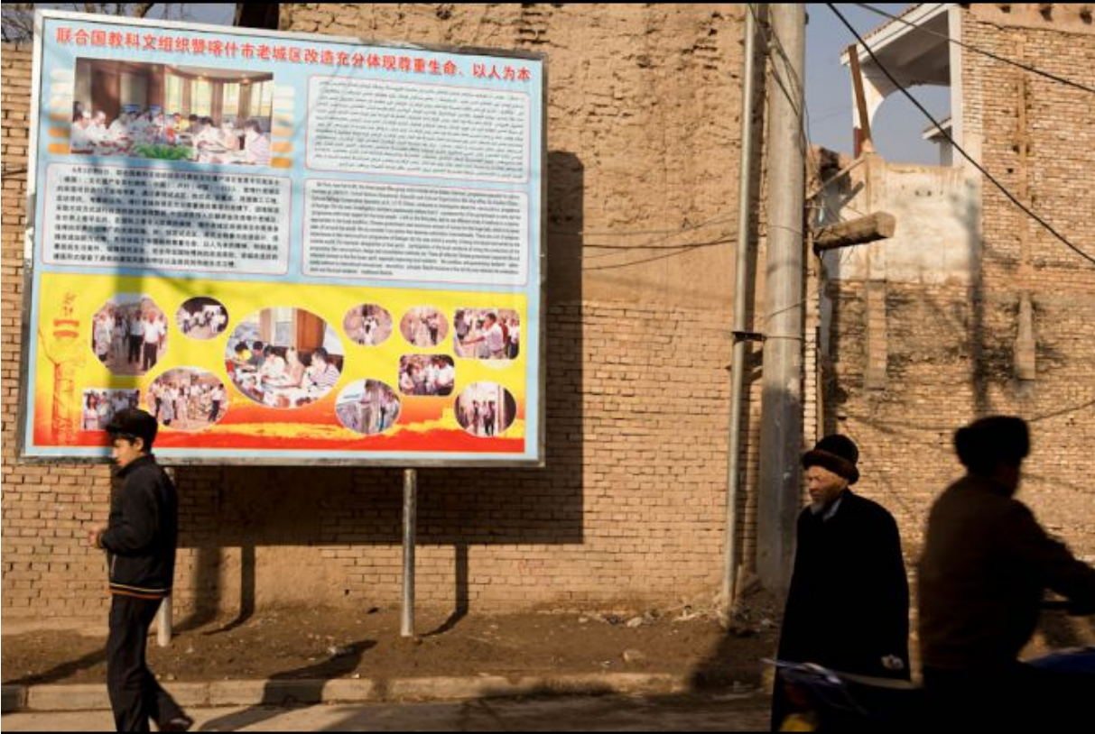
一个告诉居民联合国教科文组织赞美喀什噶尔老城拆迁项目的宣传栏

本报告在前已详述联合国教科文组织早在2004年提醒中国政府将喀什噶尔老城包括进、即将提交丝绸之路世界遗产名单中。然而，中国官员不仅无视联合国教科文组织表达的关切，而且有意歪曲联合国教科文组织驻北京代表的声明使其看起来是在支持喀什噶尔老城拆迁。喀什噶尔政府官员竖起一个宣传栏列上联合国教科文组织驻北京专家碧曲斯·卡顿（Beatrice Kaldun）的名字，告诉居民联合国教科文组织赞成拆毁喀什噶尔老城。然而，卡顿对这种扭曲她观点的行为表达了强烈的厌恶。卡顿在她给《环球邮报》的访谈中明确澄清；联合国教科文组织关心对文化遗址的保护。她说：“宣传栏是错的，”她还解释说她告诉了喀什噶尔官员他们必须尊重当地人民及其传统。 241