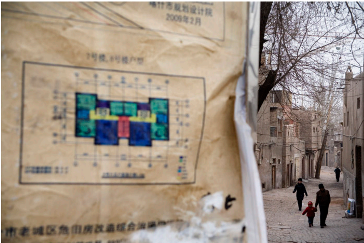
展示在喀什噶尔老城社区的再发展蓝图

喀什噶尔拆迁后安排的新居民公寓是最典型的东部中国建筑。根据互联网、图片设计蓝图，计划中为安排被拆迁维吾尔人将在拆迁区域及喀什噶尔周边要建新公寓的建筑物结构、式样和维吾尔人建筑物结构式样完全不同。 269