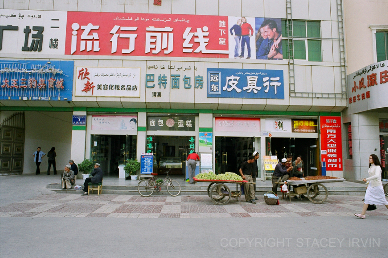
喀什噶尔开始披上东部中国的外观

在西部大开发中维吾尔人被从决策过程中边缘化是和中共一贯的政策相符。所谓的提高边疆地区“文明程度”是中共历来用以大规模以中央领导“大力推进”经济的干涉理由。这种特别的发展规划几乎没有利用当地的优势而且彻底忽略当地土著的感情因素。