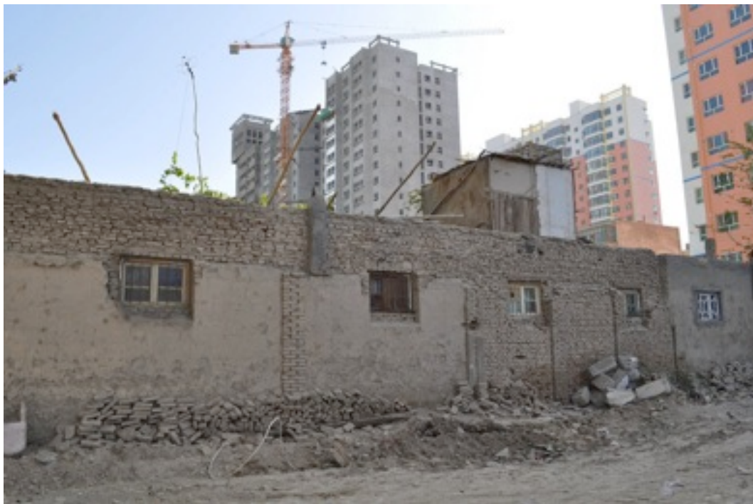
和田拆迁

根据中国人民政治协商会和和田工委网站，拆迁前和田老城人口为79,200，占和田总人口65%。工委网站于2010年6月的报告说老城有17,300户房屋需要‘改造’或‘提升’，并划拨10个亿人民币（$159,000,000）作为老城改造。工委还同时强调必须提高老城居民教育水平和职业技能。 184