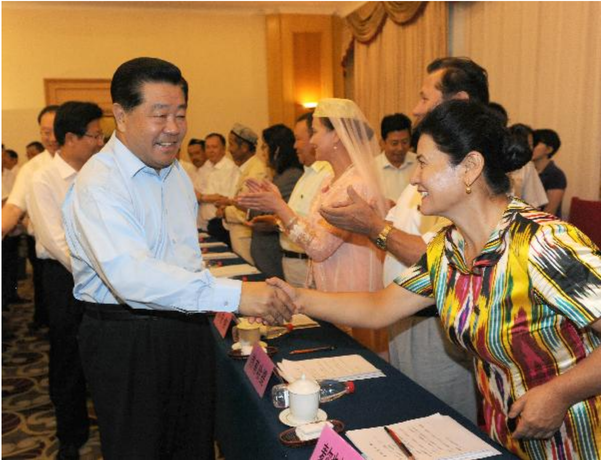
贾庆林2010年访问伊犁

2010年，广东省除了其他项目、在东突厥斯坦投资超过1个多亿（近$16000000）用于‘抗震安居工程和重建老城区旧危房’工程。 133