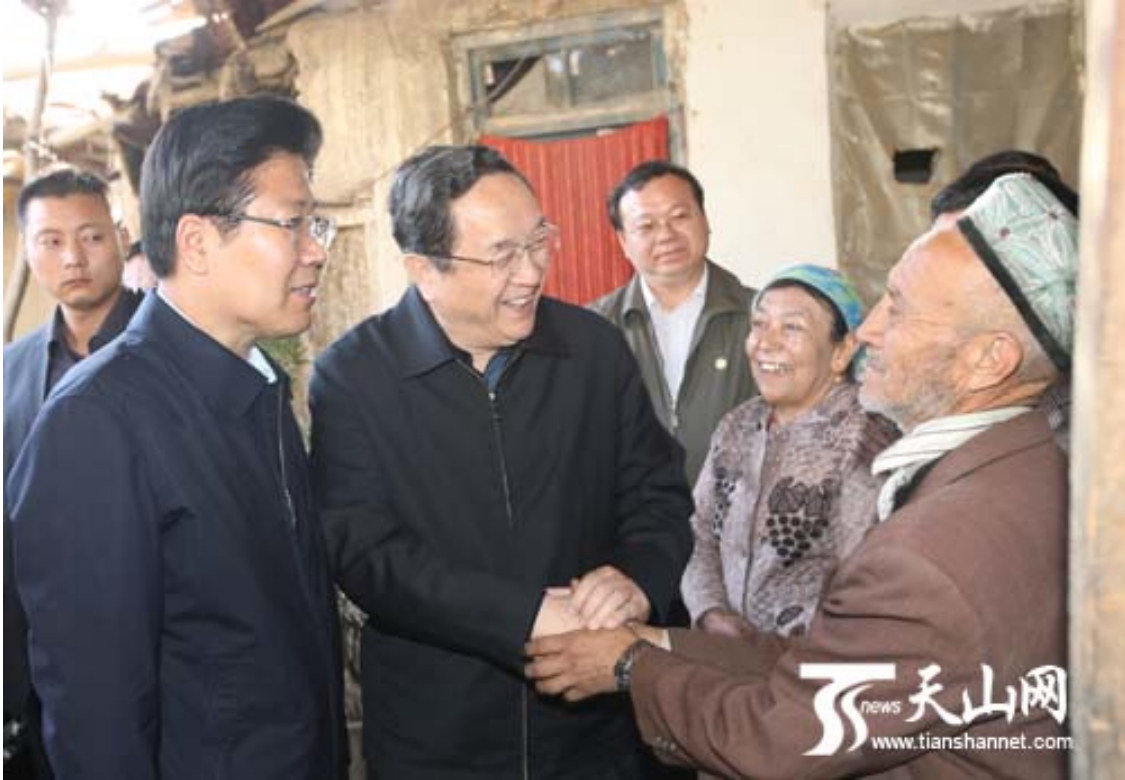
新疆党的书记张春贤和上海市委书记俞正声和喀什噶尔地区安居富民居民的图片新闻。

2011年12月在国家电视台播放的一段视频新闻突出了喀什噶尔地区伽什县图格曼巴什村维吾尔居民对一幢公寓楼的极端满意感。另一位记者报道仅2011年为喀什噶尔市郊村民新建7800所安居新楼。 160