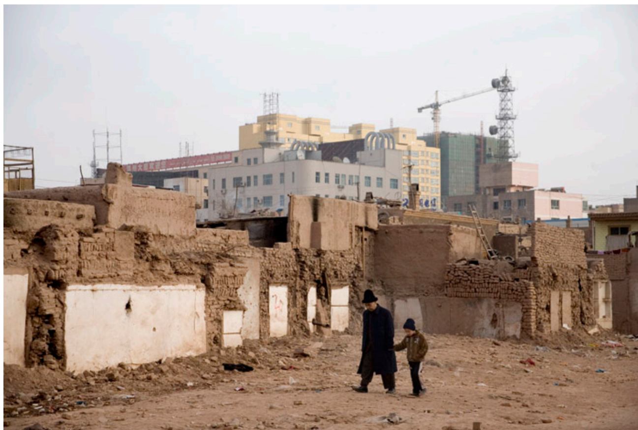
[以新、老喀什噶尔为背景的维吾尔老少步行者]

使我们国外同事失望的、成为腐败丑闻及谣言温床的城市发展，其实主要是和执行方式有关。我们不推测每一个城市发展项目背后就一定有肮脏的发展商和腐败官员；但，因为官员们很少和事关拆迁公民沟通、协商，怀疑就有理由了。 56