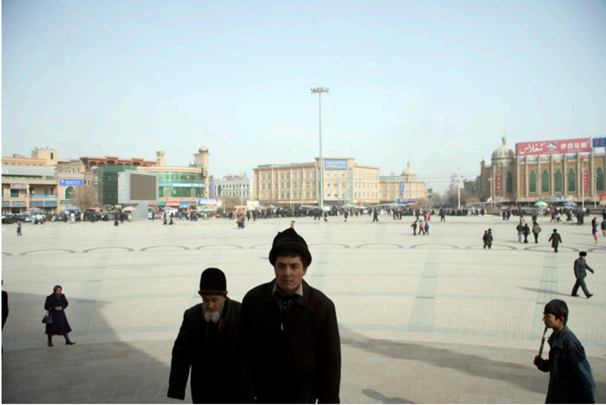
2000年代初被拆迁的喀什噶尔艾提尕尔广场

自2000年代艾提尕尔清真寺周边被拆迁至最近疯狂的拆迁，不予赔偿或给予非常少的赔偿是老城居民共同面临的问题。因2003年艾提尕尔寺周边拆迁而失去家园的维吾尔人陈述他们的生活来源曾经就在老城，而所给予赔偿“极少而且不可协商” 260 2009年5月老城居民告诉《纽约时报》既是他们提出在原有旧址重建自己房屋时，给予的赔偿也不够付重建费用。 261