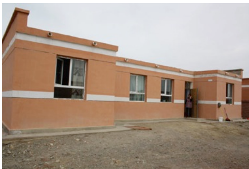
和布克赛尔蒙古自治县为定居牧民新建房屋。

2007年人权观察发布的一份报告肯定；压制藏人文化以及迫使藏人同化融入汉人社会是中国政府实施藏人牧民定居的主要因素。报告记录了定居藏牧民在有意义就业方面面临的困境，以及中国政府“在环境本该得到保护地区、热情实施大规模发展项目。” 219