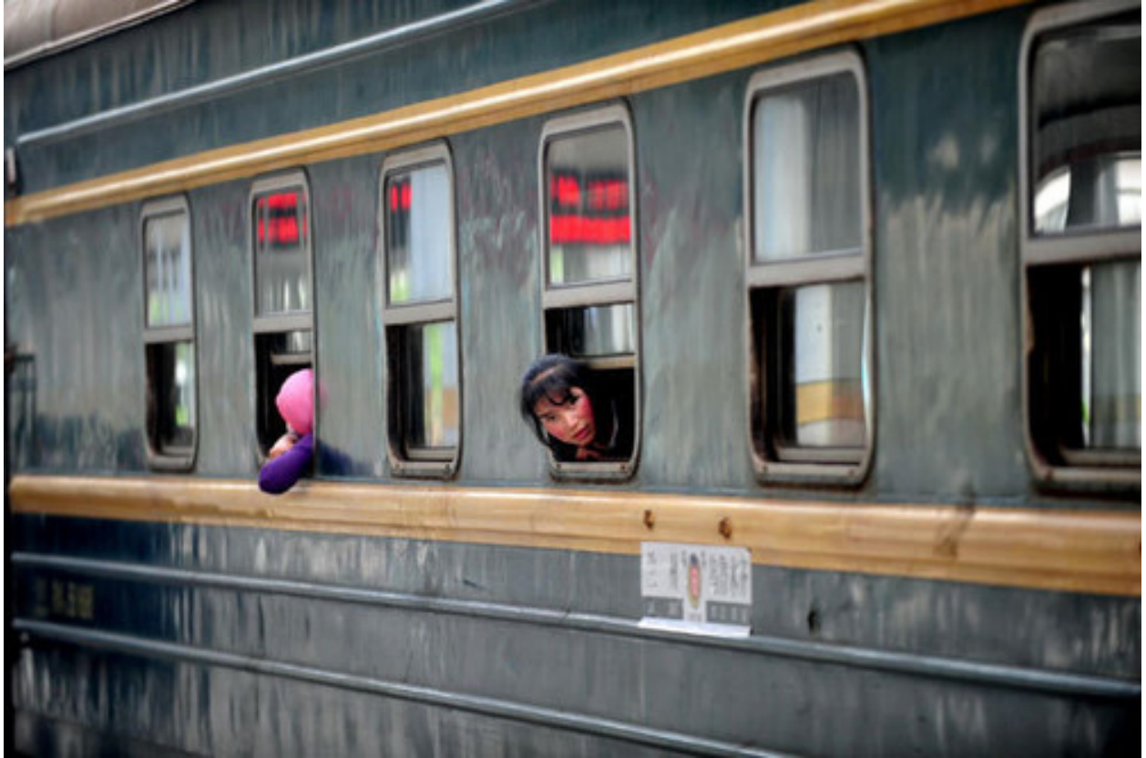
从兰州到乌鲁木齐的火车拉来了大量的汉人民工

洪流般涌入自治区的汉人移民和民工，以及他们在公共领域的主导地位使少数民族保留自己文化变得非常艰难。通过文学及实践，中华人民共和国将少数民族异域化，将他们描述为“落后”、的需要“现代化。”这导致了将少数民族排除在政治、经济过程的融合政策；事实上，尽管可能不是主要目的，但仍然使得少数民族被同化到汉文化得以实现；当然，这做法是通过大量输入汉人移民到自治区的实现的。这些政策的实施半岁的是对少数民族民事及政治权力的严重侵犯。 12