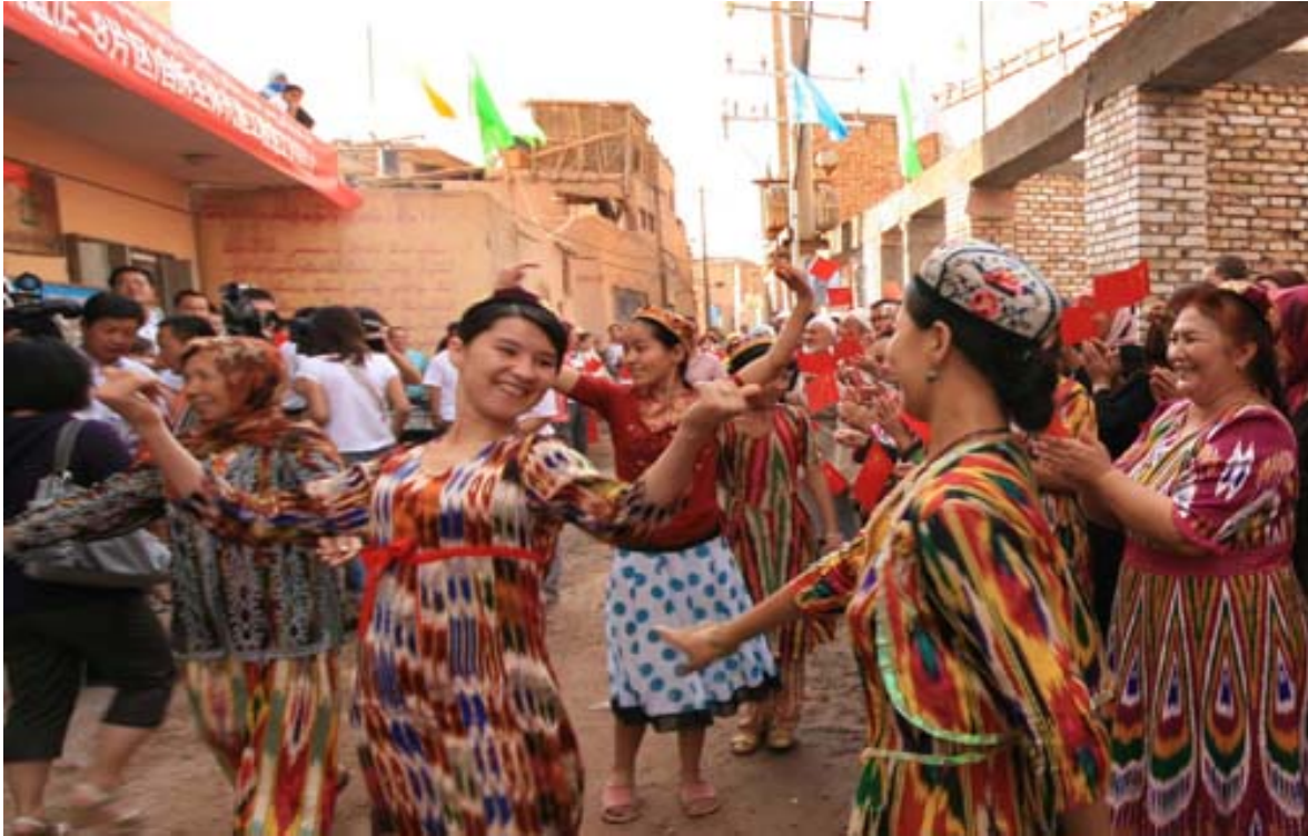
根据喀什噶尔老城改造项目网站，居民正在庆祝喀什噶尔老城重建。

一位60岁留着漂亮胡子、头戴毡帽去做晚礼拜的老人走在即将扩展为20尺的小道上表达了他极大的不满。“如果政府给我钱，我就走。每个人都不满意，但毕竟政府还是政府啊，我们能怎么样呢。”他说。 287