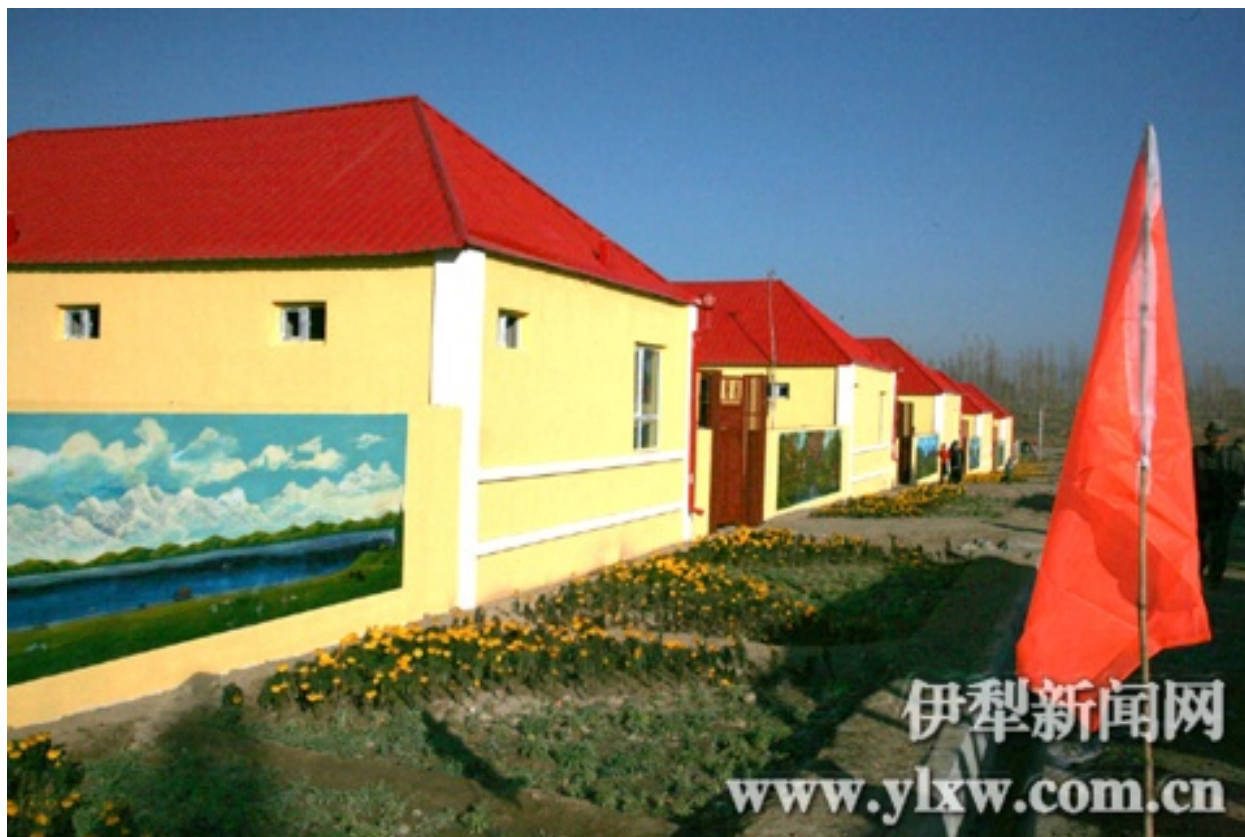
伊犁周边新的安居富民居屋。

拆毁维吾尔人家园的是也发生在伊犁及其周边地区，始自2007年的这一拆迁工程在2010年新疆工作会议后加快了步伐。据中央媒体2010年的报道：100,000伊犁维吾尔人将得益以“改造”工程。当地中共官员2006年划拨超过200,000,000的人民币用于‘改造’和‘现代化’维吾尔居民为主的、坐落于伊宁市北部的“老城”。 189 维吾尔及其他“少数民族”原住民占老城87,000总人口的77%。官方坚持老城极其需要柏油路、供水管道及其他公共设施；他们还肯定就老城改造工程和居民进行了交流、协商，包括使用公共论坛及问卷调查方式。 190